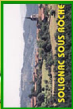
SOLIGNAC SOUS ROCHE