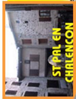
ST PAL EN CHALENCON