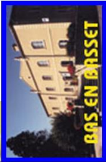
BAS EN BASSET