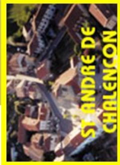
ST ANDRE DE CHALENCON