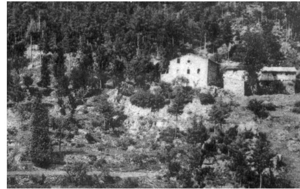
L'ermitage vers 1914

B : bois, Pé : pré, PT : pâture, T : terre, J : jardin